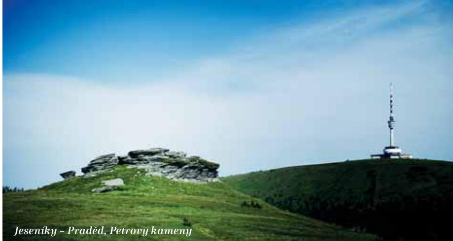
Jeseníky – Praděd, Petrovy kameny

Ecce Homo Šternberk se u nás jezdí od roku 1889. Je srdeční záležitostí nejen skalních příznivců motorismu. Rok co rok k nám do kraje přivádí desítky tisíc návštěvníků. Je jednou z posledních historických tratí, která využívá běžně používanou komunikaci. To závodníkům, i co se týče parametrů zatáček, přináší velké výzvy a divákům řadu zajímavých situací. V tom je náš závod krásný a jiný. Ale nejen motoristický sport dělá Olomoucký kraj proslulým. Nejúspěšnějším sportem je bezesporu tenis. Členka tenisového oddílu TK Agrofert