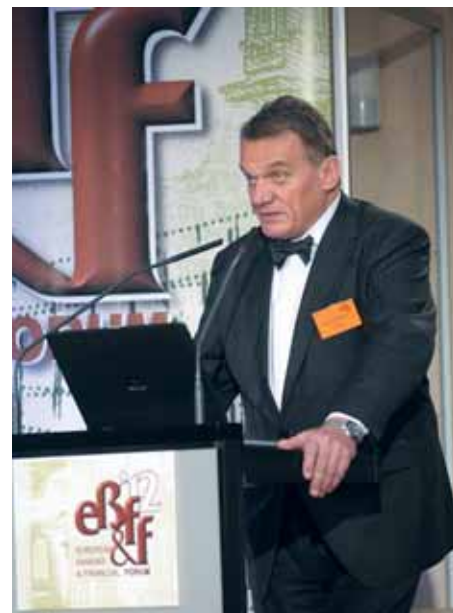
Doc. MUDr. Bohuslav Svoboda, CSc. primátor hlavního města Prahy