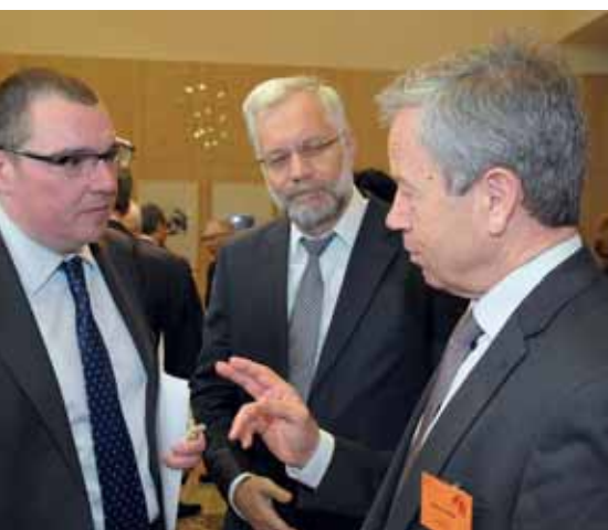
tři guvernéri v odborné diskusi během přestávky EB&FF 2012: Ing. Miroslav Singer, Ph.D., guvernér České národní banky, Grigoriy Marchenko, guvernér Kazachské národní banky, a Øystein Olsen, guvernér Norské centrální banky