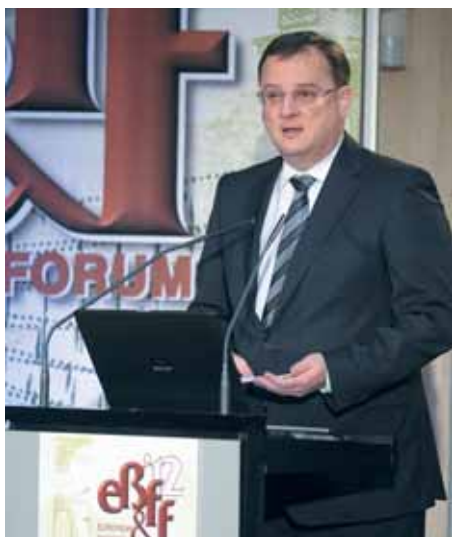
RNDr. Petr Nečas, předseda vlády České republiky