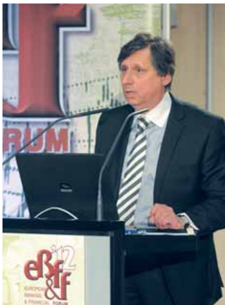
Ing. Jan Fischer, CSc., viceprezident Evropské banky pro obnovu a rozvoj