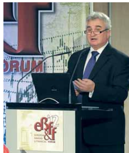
Milan Štěch, předseda Senátu Parlamentu České republiky.