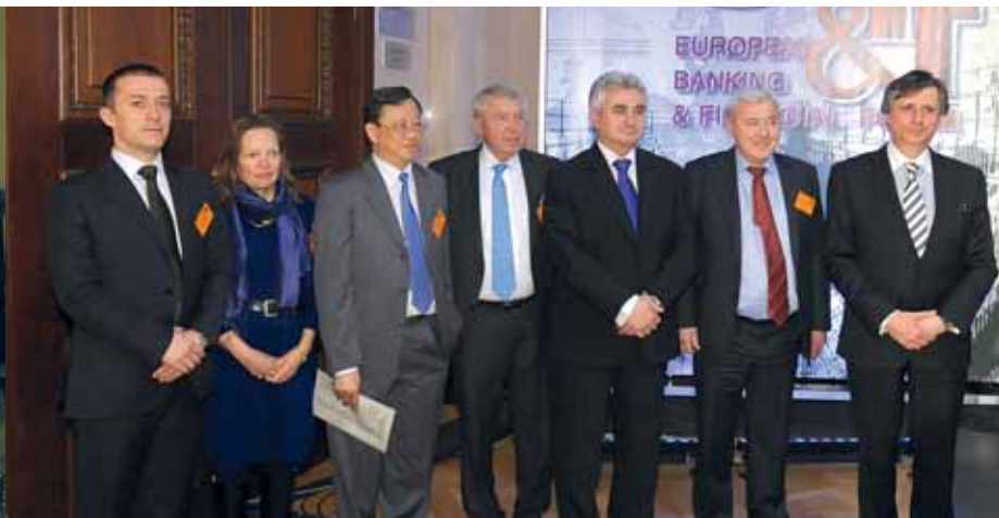
Mluvčí prvního jednacího bloku EB&FF