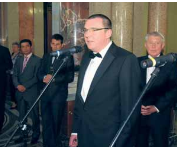
Ing. Miroslav Singer, Ph.D., guvernéř České národní banky na zahajovací recepci EB&FF 2012 v paláci České spořitelny v Rytířské ulici