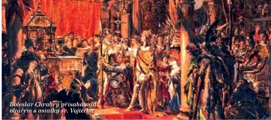
Boleslav Chrabrý přísahá nad oltářem s ostatky sv. Vojtěcha

byl prý opilec. Stejnou vlastnost však soudobé prameny připisují i novému pražskému biskupu Theddagovi. Možná to v tehdejších Čechách byl jediný způsob přežití, zmatek a hrozba na každém kroku zavdávaly exponovaným jedincům dost důvodů utápět je v alkoholovém opojení. Vladivoj však nebyl tak docela neprozíravý. Věděl, že na dvoře krále Jindřicha II. jsou dva pretendenti, kteří mají na trůn v Bohemii podstatně větší nárok než on. Byli jimi synové knížete Boleslava II. – zmrzačený eunuch