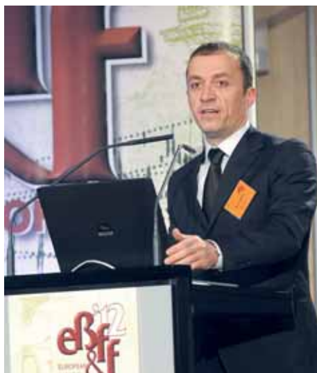
Milorad Katnic, ministr financí, Republika Černá Hora