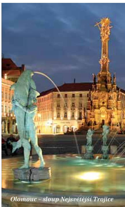
Olomouc – sloup Nejsvětější Trojice

Prostějov Petra Kvitová je wimbledonskou vítězkou. A nesmím zapomenout ani na našeho současného nejlepšího tenistu Tomáše Berdycha. Rovněž Přerov je úspěšnou tenisovou líhni. Zkrátka, český tenis má hlavní základnu v Olomouckém kraji.